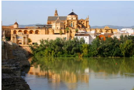
Córdoba mit Mezquita-Kathedrale